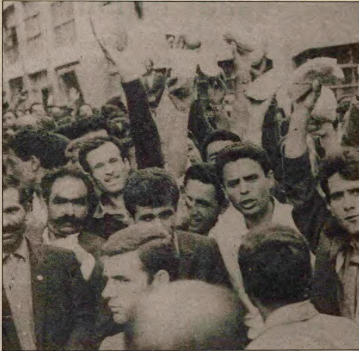
1971'de 78 gün süren Derby grevindeki sınıf dayanışması hâlâ belleklerde.

Netaş'la başladı. Derby ile gelenek hafızalarda tazelendi. Yeni yeni grevler sırada. Hiç kuşkusuz bugün sınıflar arasında ciddi bir kapışma sürüyor ve giderek büyüyor. Ne kadar hızlı olacağı, hangi engellerle karşılaşacağı bilinmez ama Türkiye devrime yürüyor.